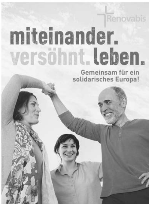
Pfingstkollekte am 20. Mai 2018